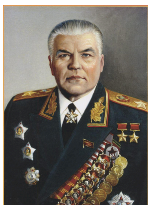
Малиновский Родион Яковлевич