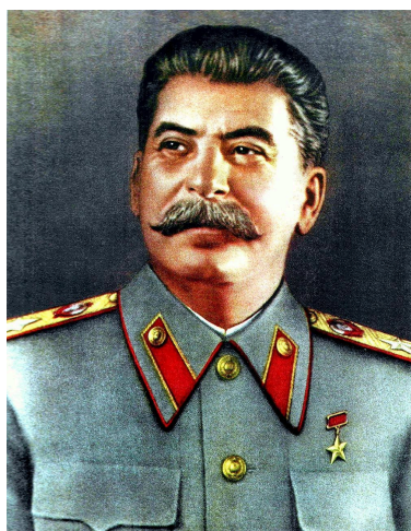
Иосиф Вессарионович Сталин