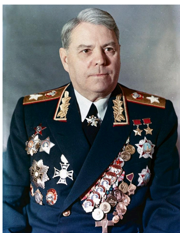
Александр Михайлович Василевский